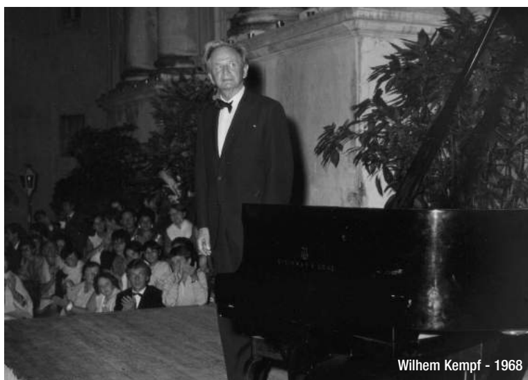
Wilhelm Kempf - 1968

- GEORGETTE ? demande Wilhelm Kempf - Non, COURGETTE ! rectifie Samson François