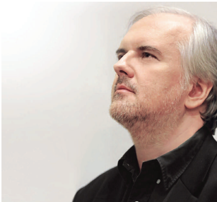
© Jean François Leclercq - Erato