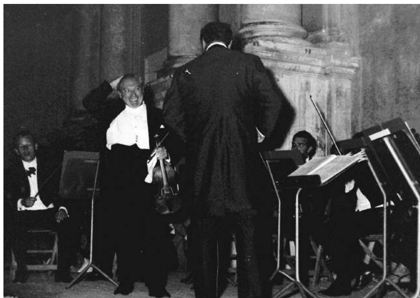
Isaac Stern - 1968